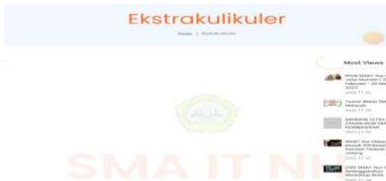
Gambar 8 Halaman Website Ekstrakurikuler SMA IT NH