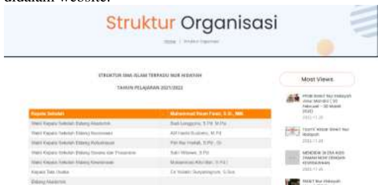
Gambar 3 Struktur Organisasi Pada Website SMA IT Nur Hidayah

Pada bagian visi misi ini belum ada apapun hanya ada berita disisi kanan dan kalender di bawahnya. Untuk visi misi nya tidak terdapat kejelasan mengenai isi visi misi sekolah ini didalam website.