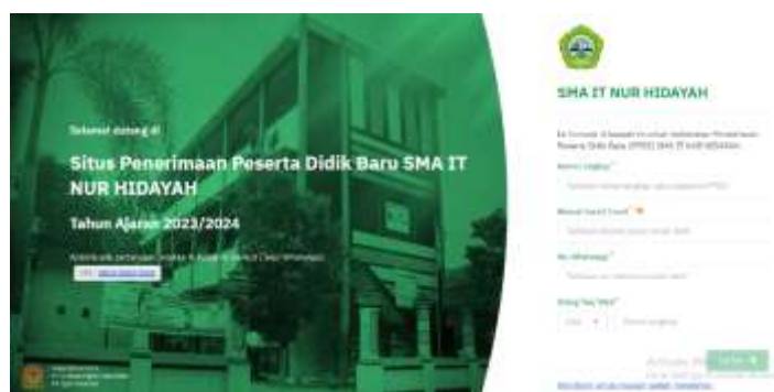
Gambar 12 Halaman Info PPDB SMA IT NH