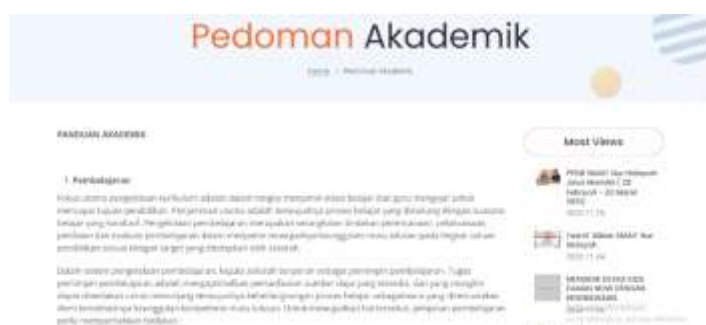
Gambar 11 Halaman Pedoman Akademik SMA IT NH

Pada halaman ini menjelaskan mengenai kurukulum yang digunakan untuk pembelajaran di SMA IT Nur Hidayah. Kurikulum SMA IT Nur Hidayah adalah menggunakan kurikulum 2013. Kurikulum 2013 dikembangkan atas dasar adanya kebutuhan akan perubahan rancangan dan proses pendidikan, dalam rangka memenuhi dinamika kehidupan bermasyarakat, berbangsa, dan bernegara, sebagaimana termaktub dalam tujuan pendidikan nasional. Kurikulum 2013 dimaksudkan untuk memenuhi tuntutan perwujudan konsepsi pendidikan yang bersumbu pada perkembangan peserta didik beserta konteks kehidupannya sebagaimana dimaknai dalam konsepsi pedagogik transformatif. Konsepsi ini menuntut bahwa kurikulum harus didudukkan sebagai wahana pendewasaan peserta didik sesuai dengan perkembangan psikologisnya dan mendapatkan perlakuan pedagogis sesuai dengan konteks lingkungan dan jamannya. Kebutuhan ini terutama menjadi prioritas dalam merancang kurikulum untuk jenjang pendidikan menengah khususnya SMA. Kurikulum 2013 dikembangkan atas teori “pendidikan berdasarkan standar” (standard-based education), dan teori kurikulum berbasis kompetensi (competency-based curriculum). Pendidikan berdasarkan standar menetapkan adanya standar nasional sebagai kualitas minimal warganegara yang dirinci menjadi standar isi, standar proses, standar kompetensi lulusan, standar pendidik dan tenaga kependidikan, standar sarana dan prasarana, standar pengelolaan, standar pembiayaan, dan standar penilaian pendidikan.