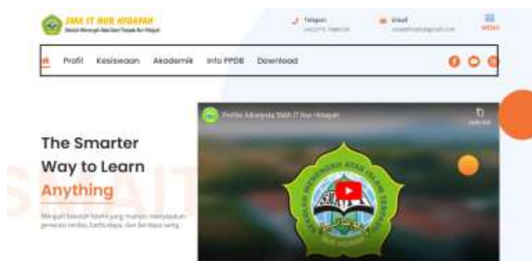
Gambar 1 Home Website SMA IT Nur Hidayah

Hasil yang didapatkan dari website yang ada di http://www.smaitnurhidayah.sch.id/ Terdapat part-part di menu yang bisa diakses dan dilihat. Berikut bagian di website Yang pertama dimulai dari tampilan di home.