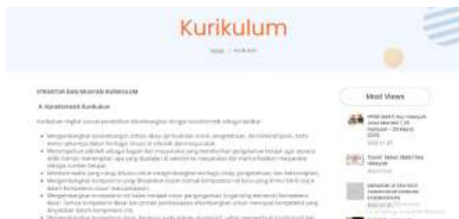
Gambar 10 Halaman Kurikulum Pada SMA IT NH