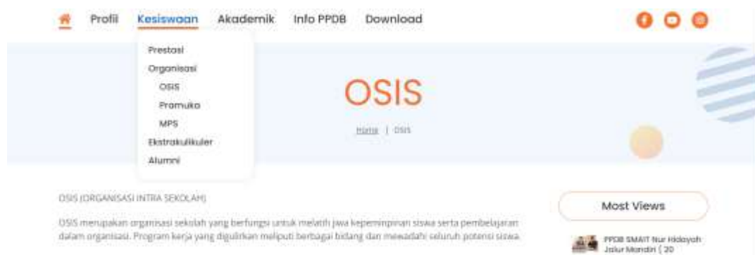
Gambar 7 Halaman Website Organisasi OSIS SMA IT NH

Pada halaman website ini terdapat tabel yang memberikan informasi mengenai prestasi yang ditorehkan oleh Siswa/I SMA IT Nur Hidayah pada Tahun 2019-2020. Untuk prestasi di tahun 2021 dan 2022 belum ada pada halaman website ini.