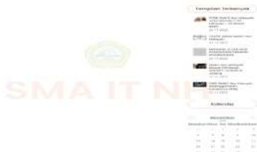
Gambar 2 Visi Misi Web SMA IT Nur Hidayah