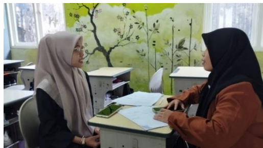
Gambar 1.4 Wawancara dengan Guru

pemberian THR memiliki nilai edukatif dan budaya yang baik. THR memberikan kesempatan bagi anak untuk belajar tentang pengelolaan uang dalam konteks budaya dan tradisi hari raya. Mendapatkan THR adalah bentuk pemahaman siswa terhadap nilai rupiah yang mereka terima (Phaldini 2024). Mengajari anak tentang konsep uang harus dilakukan dengan sabar. Bagaimanapun, pemahaman anak tentang uang perlu diajarkan dalam waktu yang panjang. Kesabaran sangat diperlukan dalam proses ini, karena anak membutuhkan waktu untuk benar-benar memahami nilai dan pengelolaan uang. Orang tua dan guru harus konsisten dan telaten dalam memberikan edukasi finansial kepada anak. (Nurhayati 2024) dengan memberikan contoh yang baik dalam pengelolaannya melalui pendalaman belajar kepedulian sesama.