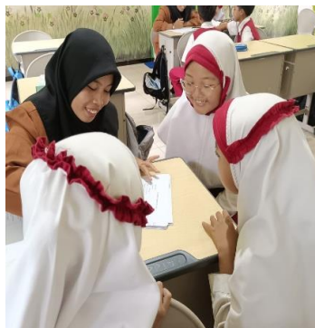
Gambar 1.3 Wawancara dengan siswa

Salah satu bekal pendidikan dan keterampilan hidup yang sangat penting untuk dimiliki oleh anak adalah kemampuan mengelola uang (Soenjoto 2023). Mengajarkan aspek menghasilkan uang kepada siswa sekolah dasar adalah langkah awal dalam membangun literasi keuangan sejak dini. Berdasarkan hasil wawancara dan penyebaran angket diketahui bahwa banyak siswa yang masih memiliki pemahaman yang sangat mendasar tentang konsep uang dan cara memperolehnya (Raphi 2016).