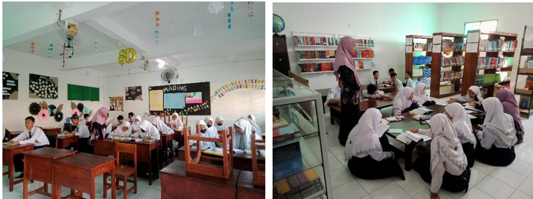
Gambar 1. Pelaksanaan Budaya Literasi

“Adapun karya berupa papan mading ini sifatnya terjadwal dengan jarak selama 3 minggu. Contohnya hari ini kelas VII-A menampilkan hasil karyanya sesuai tema di papan mading sekolah, maka 3 minggu berikutnya kelas VII-B harus sudah disiapkan hasil karyanya. Sedangkan papan mading yang terletak di dalam kelas berisikan tugas siswa maupun isi curahan hati siswa”.