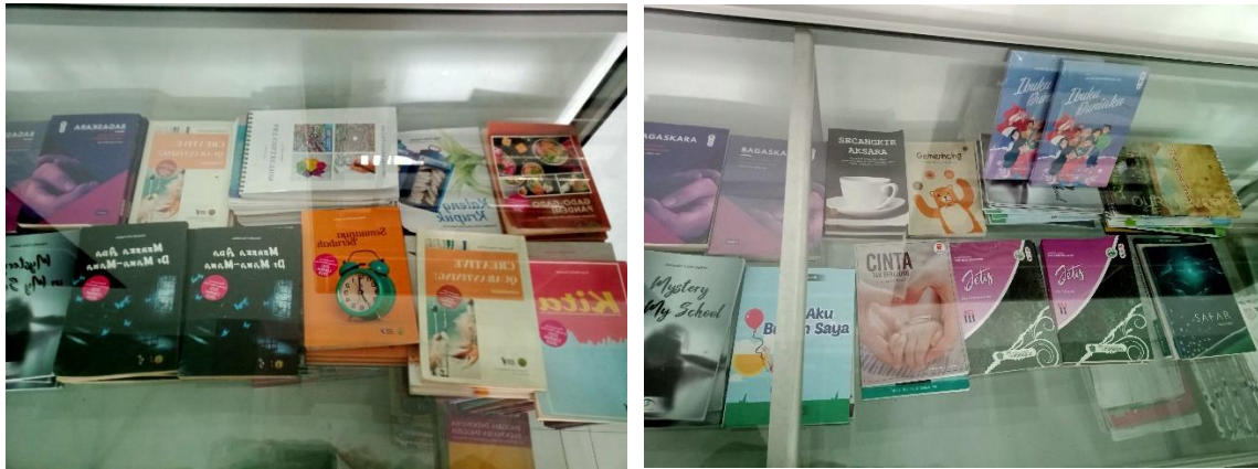
Gambar 3. Hasil Kreativitas Siswa Berupa Buku