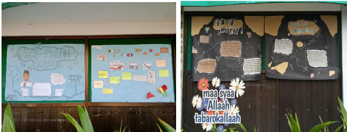
Gambar 4. Hasil Kreativitas Siswa Berupa Papan Mading