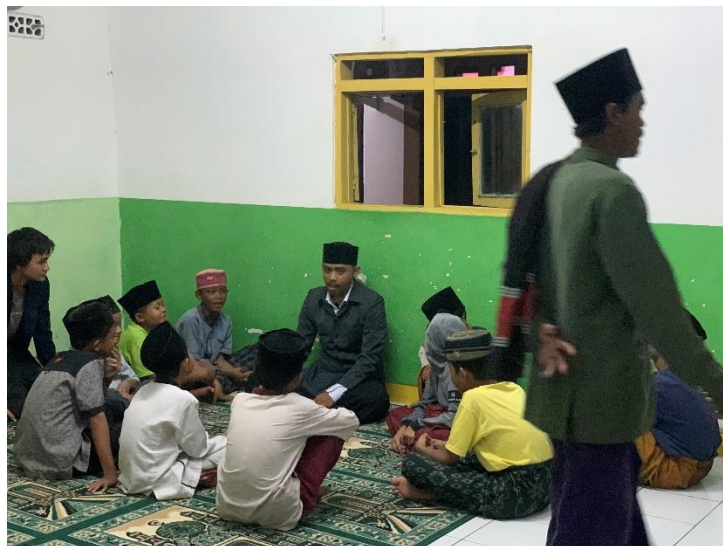
Bagan 1 Kegiatan pelatihan yang didampingi oleh Ustadz

Tujuan dari acara ini adalah untuk menyelenggarakan pelatihan tilawatil Quran bagi masyarakat dengan dua tujuan utama: pertama, memperbaiki bacaan al-Quran mereka; dan kedua, menyiapkan kader yang mampu membawakan tilawatil Quran dengan baik dan tepat dalam setiap acara yang diadakan oleh masyarakat Desa.