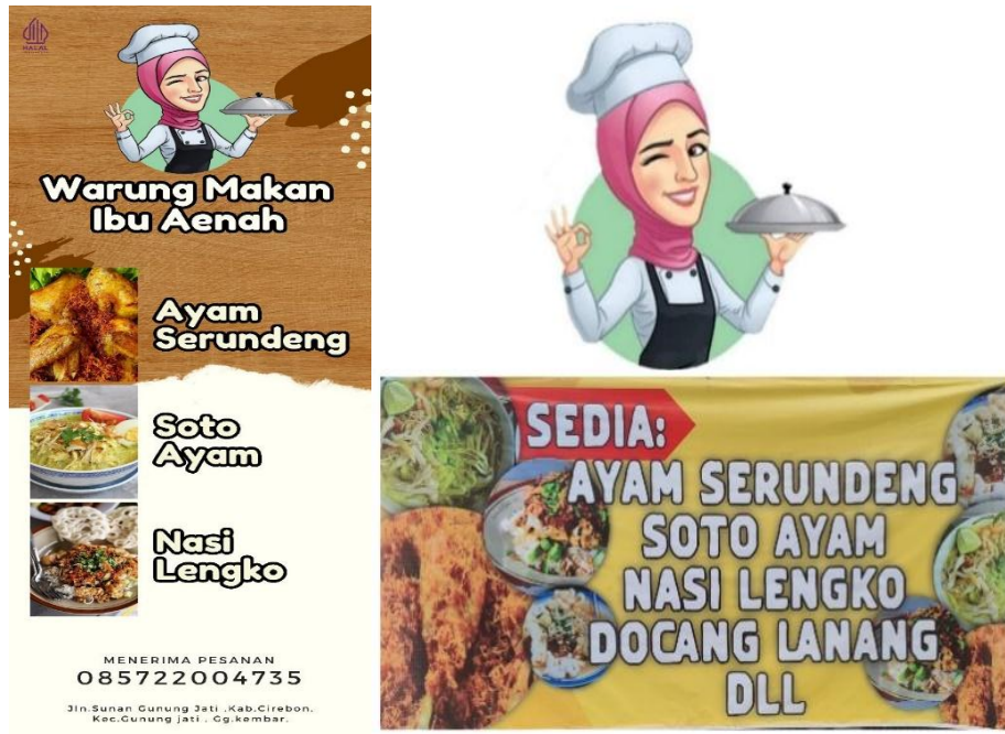
Gambar 4. Desain X-Banner, Logo dan Spanduk