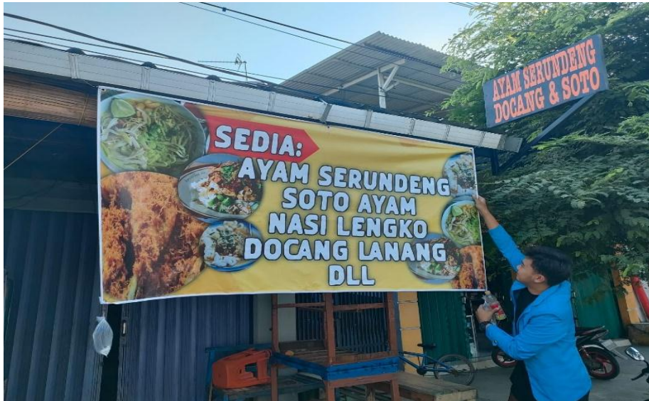
Gambar 6. Pemasangan Spanduk

Kegiatan selanjutnya kami memasang banner x dan spanduk agar para pelanggan dapat melihat Warung Masakan Ibu Aenah karena fungsi spanduk sendiri adalah media untuk menginformasikan sekaligus mempromosikan suatu produk. Dalam hal ini, spanduk diletakan di lokasi strategis seperti pada gambar sehingga dapat membantu meningkatkan kesadaran masyarakat terhadap produk tersebut dan dapat menarik niat masyarakat untuk membeli.