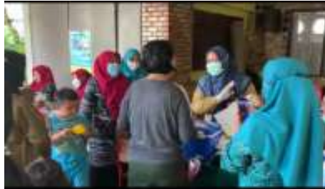
Gambar 5. Meja Penyuluhan

Berdasarkan data yang telah di isi pada KMS, maka petugas akan melakukan penyuluhan terkait tumbuh kembang anak.