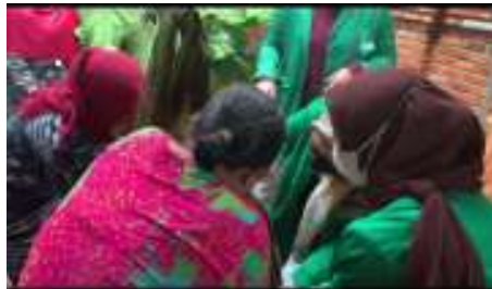
Gambar 3. Meja Penimbangan

Untuk balita yang telah dilakukann pendaftera kemudian di timbang untuk data berat badan, diukur area kepala untuk mendapatkan data lingkar kepala, diukur tinggi badan untuk mendapatkan data tinggi badan anak.