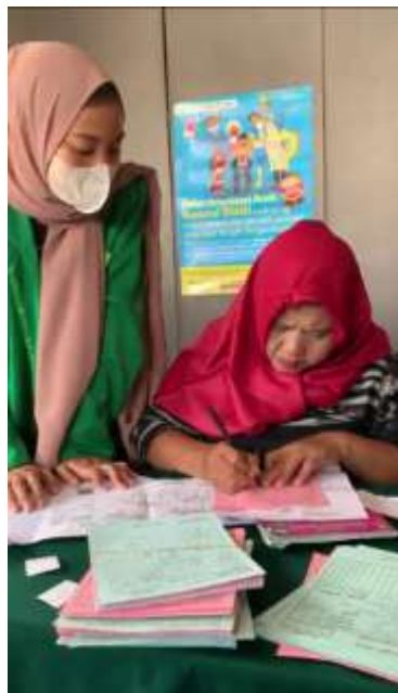
Gambar 4. Meja Pengisian KMS

Kartu Menuju Sehat (KMS) adalah kartu yang digunakan untuk pengisian pendataan dari hasil pengukuran, sehingga perkembangan dari anak dapat diketahui dan di baca data recordnya.