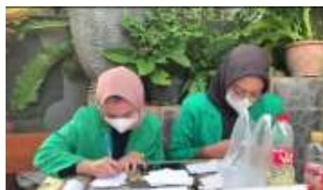
Gambar 2. Meja Pendaftaran