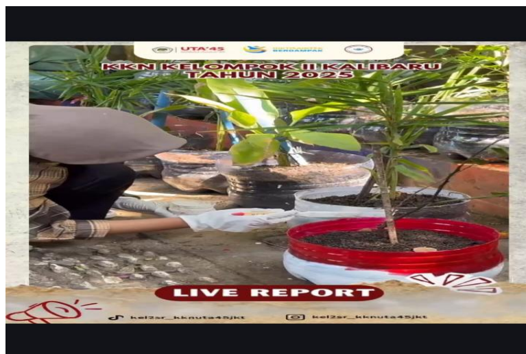
Gambar 5. Dokumentasi kegiatan penanaman dan workshop TOGA