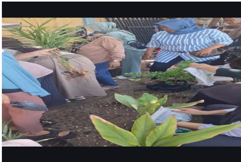
Gambar 3. Dokumentasi kegiatan penanaman dan workshop TOGA