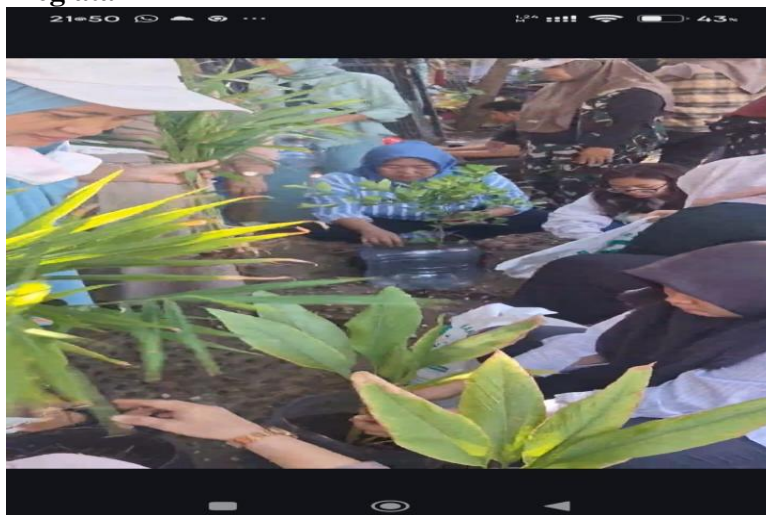
Gambar 1. Dokumentasi kegiatan penanaman dan workshop TOGA