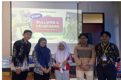
Gambar 2. Pemberian reward dari games