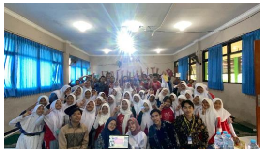
Gambar 3. Foto bersama setelah kegiatan

Setelah pemberian materi, dilakukan post-test dan evaluasi untuk mengetahui apakah materi yang diberikan dapat dipahami dengan baik dan untuk mengetahui apakah materi sudah sesuai dengan apa yang dibutuhkan siswa. Post-test berisi pertanyaan pilihan ganda dan evaluasi berisi pertanyaan dengan pilihan jawaban dari skala 1 sampai 4.