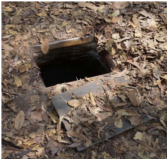
Gambar 1. Pintu masuk terowongan disamarkan dengan tanah, daun, dan ranting agar tersembunyi. Kompleks ini memiliki banyak pintu masuk di berbagai lokasi untuk memudahkan keluar cepat jika terowongan terdeteksi.

Sebagian besar pintu masuk ini juga berfungsi sebagai jebakan yang tersamar oleh tanah, debu, atau dedaunan. Pada pintu-pintu yang langsung terbuka ke permukaan tanah, para pejuang akan menutupinya dengan ranting kering, dedaunan, dan tanah lepas yang terus diperbarui setiap tiga hari sekali, agar tetap terlihat alami dan tidak mencurigakan. Selain itu, lokasi pintu masuk biasanya dipilih di area yang lebih tinggi dan memiliki sirkulasi udara yang baik. Pemilihan lokasi ini bertujuan untuk menghindari risiko banjir saat musim hujan, kebakaran, serta serangan senjata kimia yang sering dilancarkan oleh pasukan musuh. Semua ini menunjukkan betapa cermat dan strategisnya perencanaan sistem pertahanan bawah tanah yang dimiliki Viet Cong. Terkadang pintu masuk terowongan dibuat tersembunyi di tempat yang tak terduga, seperti di dalam kandang babi, lokasi yang jarang diperiksa oleh tentara Amerika Serikat [27].