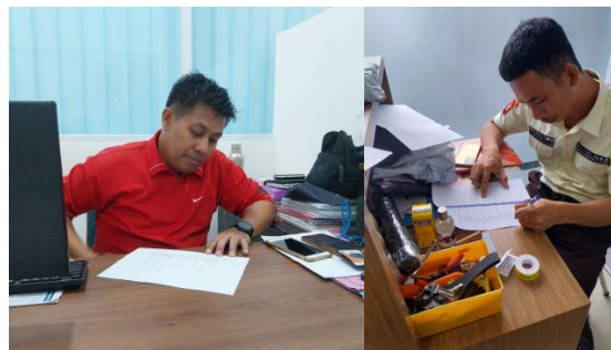
Gambar 1.4 Pemberian Posttest

Setelah pemberian materi poster, maka di lanjutkan dengan pemberian posttest , yang dimana bertujuan untuk melengkapi perbandingan data untuk di analisis apakah adanya peningkatan atau tidak dalam kesadaran mengenai prioritas pada responden.