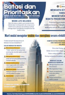
Gambar 3.1 Poster Psikoedukasi

Setelah pemberian materi poster, maka di lanjutkan dengan pemberian posttest , yang dimana bertujuan untuk melengkapi perbandingan data untuk di analisis apakah adanya peningkatan atau tidak dalam kesadaran mengenai prioritas pada responden.