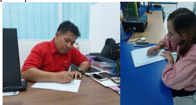
Gambar 1.1 Pemberian Pretest

Selanjutnya setelah melakukan pembukaan, maka di lanjutkan dengan penjelasan dan pretest . Hal ini bertujuan untuk memberikan pemahaman kepada para responden terkait sistematika dari isi poster psikoedukasi tersebut.