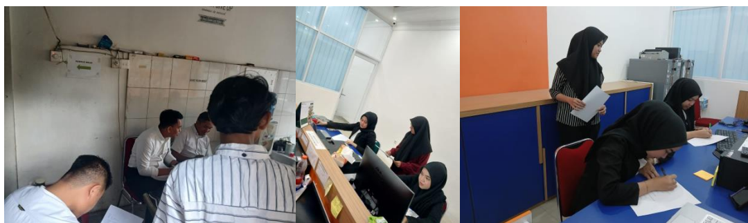
Gambar 2.1 Pemberian Materi Media Poster

Setelah melakukan beberapa rangkaian di atas, seperti pre-test dan penjelasan, maka peneliti melanjutkan dengan memberikan materi. Materi tersebut di bawakan dengan media poster psikoedukasi, yang dimana berisi materi terkait work life balance , kesadaran, serta prioritas. Materi tersebut nantinya akan di baca dan di terangkan oleh peneliti agar tidak menjadi bias dalam pemahaman responden.