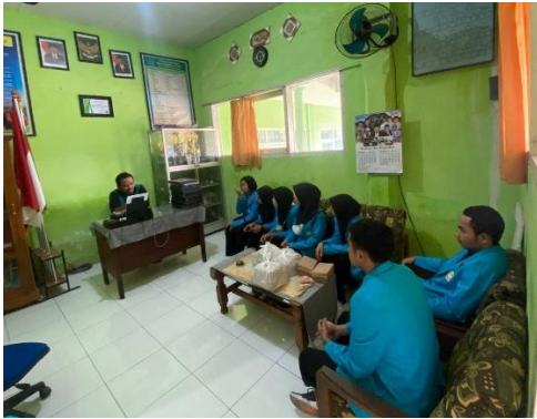
Gambar 1. Koordinasi dengan Kepsek