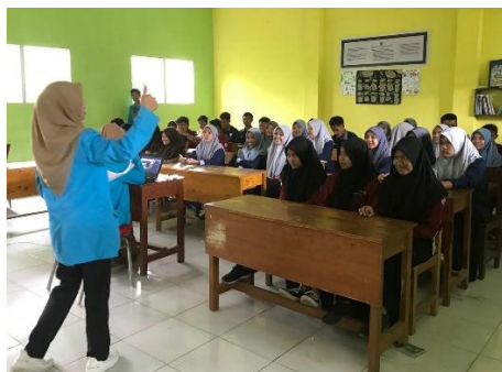
Gambar 4. Penyuluhan Kebersihan Lingkungan

Di kegiatan pertama, yaitu penyuluhan, tim pengabdian berbagi tugas menjadi pemateri, moderator, operator, dan lain-lain untuk menyampaikan materi penyuluhan bertema Kebersihan Lingkungan. Sasaran kegiatan ini adalah pengurus OSIS yang diharapkan dapat menjadi role model bagi siswa-siswi sekolah MTs dan MA Bahrul Ulum Jatisari. Pemateri membahas tentang hal-hal yang dapat mengakibatkan lingkungan menjadi kotor dan tercemar, serta dampak-dampak yang akan ditimbulkan jika warga sekolah tidak menjaga dan peduli terhadap lingkungan hidup. Lingkungan sekolah yang kurang sehat adalah akibat kebiasaan membuang sampah secara sembarangan. Para siswa terlihat antusias dalam mengikuti penyuluhan dan termotivasi untuk selalu menjaga kebersihan lingkungan agar tidak menjadi sumber penyakit dan tidak mencemari lingkungan. Siswa-siswi merespon dengan positif kegiatan ini dengan mengajukan beberapa pertanyaan terkait bagaimana membiasakan diri menjaga lingkungan bersih.