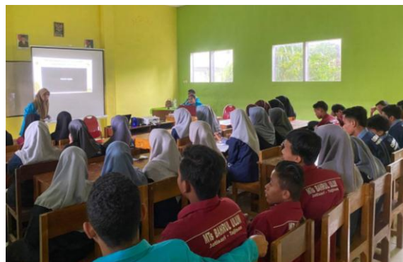
Gambar 7. Berdiskusi & memotivasi siswa

Pada tahap refleksi, tim pengabdian mengajak mahasiswa Pendidikan Tadris Matematika UJatrisari untuk berdiskusi dan saling memberikan motivasi. Tim pengabdian selalu menjaga kebersihan lingkungan di manapun mereka berada, baik di rumah. Pengadaan tempat sampah oleh tim pengabdian di lingkungan sekolah diharapkan dapat agar selalu menumbuhkan kesadaran di kalangan siswa-siswi di MTs dan MA Bahrul Ulum Jatisari akan pentingnya menjaga lingkungan agar selalu bersih dan sehat karena terhindar dari penyakit. Warga sekolah, termasuk guru-guru sangat mendukung kegiatan ini karena memberi dampak yang positif bagi siswa-siswi MTs dan MA Bahrul Ulum Jatisari.