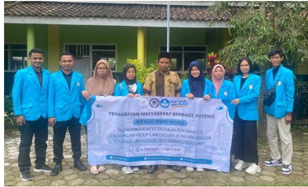
Gambar 2. Permohonan izin pengabdian