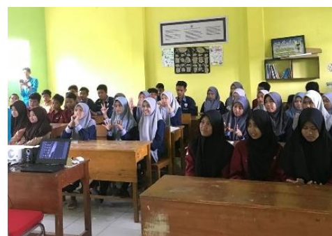
Gambar 5. Antusiasme siswa OSIS

Kegiatan berikutnya adalah pemdampingan kerja bakti dan bergotong royong membersihkan lingkungan sekolah. Pada kegiatan ini, secara bergilir sesuai jadwal piket