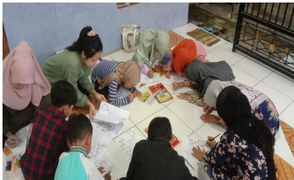
Foto 3 Kegiatan pendampingan kepada anak

Kegiatan mewarnai juga dibuat sebagai lomba mewarnai kaligrafi Islam untuk melihat sejauh mana minat anak-anak dalam mewarnai kaligrafi dengan memilih tiga gambar yang paling rapi dalam mewarnai dan akan di beri hadiah. Pemberian hadiah adalah sebagai apresiasi kepada anak-anak dalam kegiatan ini. Mengenal kaligrafi sangat penting dalam hidup masyarakat terutama pada anak-anak. Pengenalan kaligrafi dalam dilakukan dengan bermacam metode seperti mewarnai agar tidak menimbulkan rasa bosan pada anak. Kaligrafi adalah tulisan atau huruf yang mengandung keindahan dan keestetikan di dalamnya.