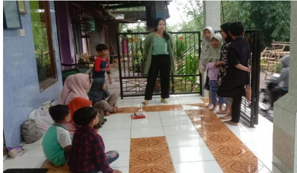
Foto 1 Kegiatan tahap awal dengan memberikan penjelasan tentang kegiatan Pendampingan

Ada respon yang baik dari anak-anak dalam menanggapi program yang diberikan dengan sangat antusias mendengarkan penjelasan mengenai kegiatan mewarnai dan mengenal kaligrafi.