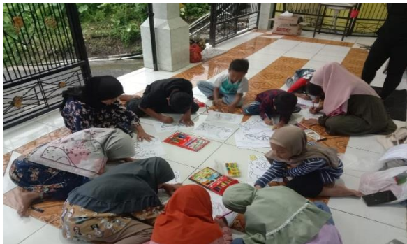
Foto 2 Tahap Implementasi pelaksanaan kegiatan mewarna dan mengenal kaligrafi

Kreativitas merupakan sebuah proses dimana timbulnya keinginan atau hasrat dalam diri untuk menciptakan dan membuat hal yang baru yang kreatif. Dalam KBBI (1988: 456) kata "kreativitas diartikan sebagai suatu kemampuan untuk mencipta.