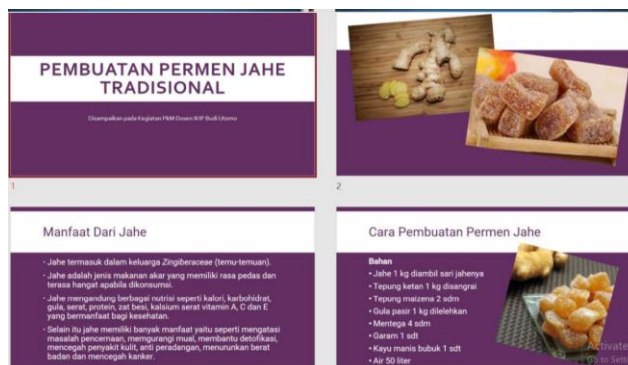
Resep pembuatan permen jahe