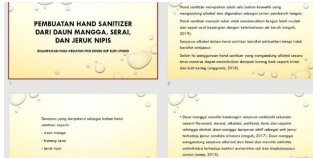
Langkah-langkah pembuatan hand sanitizer

Dusun Bugis Desa Saptorenggo Kecamatan Pakis. Kegiatan ini juga bertujuan untuk memberdayakan warga dalam upaya mengatasi perekonomian keluarga, mengingat harga hand sanitizer produksi pabrik cukup mahal. Dengan memanfaatkan bahan yang sudah tersedia di lingkungan sekitar, kebutuhan akan hand sanitizer di pasca pandemic dapat dipenuhi.