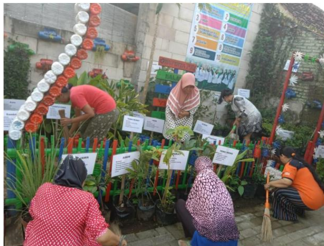
Gambar 2. Penanaman kembali dan perawatan TOGA