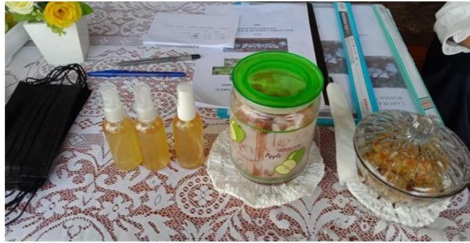
Gambar 1. Hasil pembuatan handsanitizer dan permen jahe