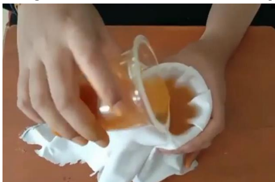
Gambar 3. Mengekstrak Kunyit

Tim pengabdian secara demonstrasi mengidentifikasi keempat makanan tersebut dan diperhatikan oleh seluruh peserta penyuluhan yaitu peserta PKM Jombang. Kegiatan mengidentifikasi boraks dalam makanan dapat dilihat pada Gambar 3 dan Gambar 4 berikut.