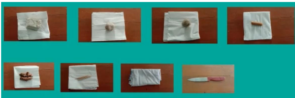
Gambar 2. Alat dan Bahan Identifikasi Boraks

Setelah penyuluhan kepada warga tentang edukasi boraks dalam makanan, selanjutnya warga mempraktikkan untuk identifikasi boraks yang ada dalam untuk produk makanan. Alat yang digunakan untuk mendeteksi boraks dalam makanan menggunakan metode sederhana yaitu tusuk gigi dan kunyit. Makanan yang diidentifikasi kandungan boraksnya oleh tim pengabdian adalah pentol bakso, tahu, cilok seperti pada Gambar 2.