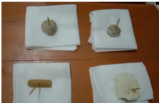
Gambar 5. Uji Identifikasi Boraks dengan Metode Sederhanan

Setelah merendam beberapa tusuk gigi ke dalam ekstrak kunyit, langkah selanjutnya adalah identifikasi tusuk gigi hasil rendaman ekstrak kunyit terhadap empat makanan yang akan diidentifikasi kandungan boraksnya.