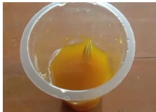
Gambar 4. Merendam Tusuk Gigi ke Ekstrak Kunyit