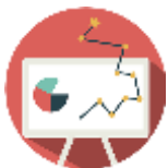
Table 4.1 Histogram Tingkat Pengetahuan