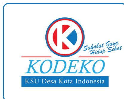
Gambar 4. 3 Logo Brand Usaha KODEKO

Gambar 4.9 menampilkan logo brand dari usaha-usaha Koperasi Serba Usaha Desa Kota Indonesia dengan sebutan "KODEKO". Logo ini merupakan identitas visual yang