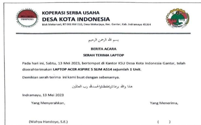
Gambar 4. 5 Berita Acara Serah terima Barang

Gambar 4.13 menampilkan berita acara serah terima barang (Laptop) di Koperasi Serba Usaha Desa Kota sebagai bentuk bukti serah terima secara administratif