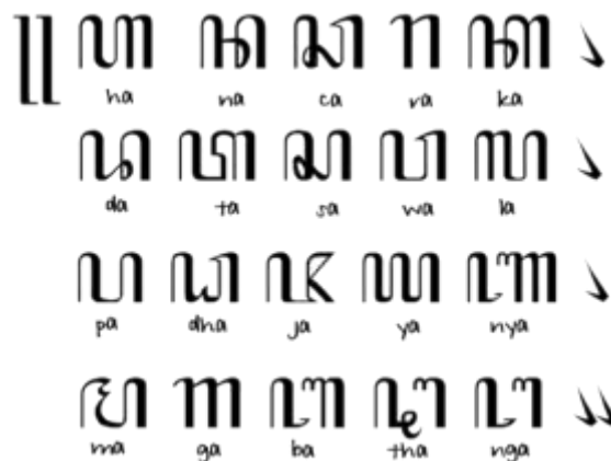
Gambar 2. Bentuk Aksara Jawa

Sejarah aksara Nusantara juga ditandai dengan munculnya Cerita Aji Saka yang dikenal dengan Susunan alfabet aksara Jawanya yang berbentuk pangram, yakni menggunakan semua huruf dalam suatu aksara paling tidak satu kali. Aksara Kawi yang dipakai etnik Jawa muncul pertama kali setelah orang-orang India datang ke pulau Jawa. Aksara Jawa modern dibuat sebagai kenang-kenangan Prabu Aji Saka yang dipersembahkan kepada Dora dan Sembada, abadinya yang tewas terbunuh karena keduanya beradu kesaktian menjaga pesan Aji Saka. Dari simbol visual tersebut ada hal yang dapat diketahui yaitu pertama, sarat dengan falsafah kehidupan atau penuh muatan simbolisasi religius-spiritual, yakni "HANA CARAKA, DATA SAWALA, PADHA JAYANYA, MAGA BATHANGA". KEDUA, menjadi momentum sistem penanggalan Tahun Saka (Tahun Jawa) yang dimulai pada tahun 78 Masehi. Aksara Jawa memiliki sistem aksara pasangan yang mana jika suatu huruf hendak dimatikan vokalnya maka huruf selanjutnya akan digantung atau ditempel pada bagian bawah aksara sebelumnya. Jika ia merupakan silabel terakhir dan tak ada huruf lagi setelahnya, maka barulah huruf tersebut akan ditulis dengan virama. Bentuk pasangannya tidak berbeda jauh dari aksara induknya. Melalui aksara Jawa inilah maka menjadi kerabat penulisan aksara Bali dan Sunda, Berikut adalah bentuk aksara Jawa.