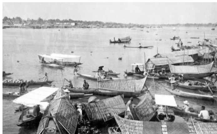
Gambar.2 sungai Musi pada zaman dulu

Pemerintah Kolonial Belanda resmi berdiri di Palembang ditandai dengan berkibarnya bendera di bastion Kuto Besak pada 1 Juli 1821 (Adiyanto, 2017: 93). Menurut Tanjung (2019: 1) Hal ini dikarenakan sebelum abad ke-20 ilmuwan Barat memusatkan kajiannya di bidang masyarakat pedesaan, peraturan adat, agrikultur, susunan keluarga, dan religi di wilayah Pulau Jawa. Keunikan dan ciri khas pedesaan di Indonesia merupakan alasan kuat Ilmuwan Barat lebih tergiur meneliti kawasan ini daripada kawasan perkotaan. Barulah setelah tahun 1910 perhatian ilmuwan Barat mulai beralih ke perkotaan di Indonesia termasuk di Palembang sebagai salah-satu wilayah dudukan Belanda.