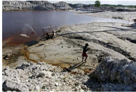
Gambar.1 keberadaan tambang timah di Bangka Belitung

oleh Kesultanan Palembang setiap tahun meningkat, misalnya dari 1.110 pikul pada 1733 menjadi 16.000 pikul pada 1754 (Horsfield 1848: 299–336).