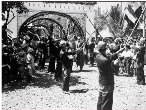
Gambar.3 Palembang dalam Desentralisasi