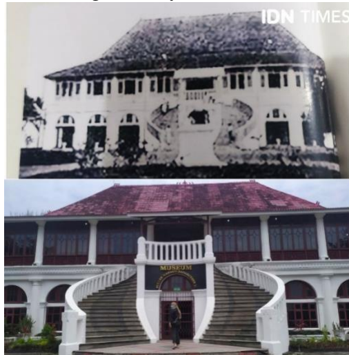
Gambar.7 Potret dahulu dan sekarang Museum SMB II di Palembang

Secara resmi tanggal 7 Oktober 1823, Belanda membubarkan Kesultanan Palembang dan menjadi Keresidenan Palembang. Sehingga secara de jure, seluruh wilayah Sumatra Selatan (Sumsel) dikuasi Belanda. Dahulu, rumah Keresiden (pemerintah) Kolonial berada di museum SMB II yang dibangun pada tahun 1823 dan selesai tahun 1825. Kemudian setelah masa kepemimpinan kolonial berakhir, lokasi tersebut diresmikan menjadi Museum SMB II pada tahun 1984.