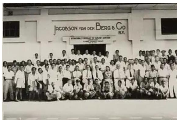
Gambar.8 Personil Perusahaan Jacobson Van den Berg & Co di Palembang,

Jacobsen Van Den Berg gedung tua bersejarah peninggalan zaman dagang Belanda dan termasuk cagar budaya yang ada di Provinsi Sumatera Selatan (Sumsel). Gedung Jacobsen Van Den Berg di Kota Palembang ini merupakan kantor dagang Belanda yang dibangun sekitar tahun 1800-an. Pada tahun 1960,