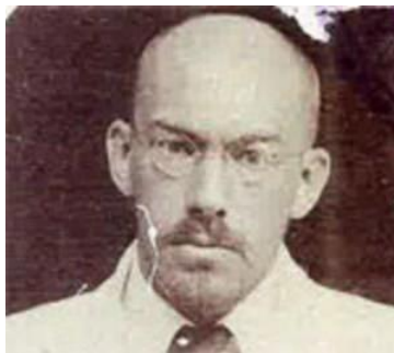
Gambar.4 Thomas Karsten: Arsitek kolonial belanda

Thomas Karsten atau Henri Maclaine Pont sangat mempengaruhi perkembangan tersebut. Mereka merancang dengan sintesa yang memperhatikan tradisionalisme yang modern bersama arsitektur Indies . Belanda melakukan pembangunan berdasarkan masterplan yang disusun Thomas Karsten. Tata kota baru' ini mengacu pada landhuis kota Batavia dengan penyesuaian kondisi teknologi, bahan dan iklim kota Palembang, namun terfokus pada kepentingan golongan masyarakat Belanda. Dengan demikian Kota Palembang bertransformasi dari kota air menjadi kota darat (Adiyanto, 2017: 93).